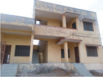
चिकित्सक सहित स्टाफके स्थगि निवास के लिए डबल स्टोरी आवासीय भवन जिनमें

विश्व और पूरा देश वैश्विक महामारी कोविड-19 की दूसरी लहर की चपेट में होकर स्थितिर्था नियंत्रण के बाहर है। शहरों यदित इस बार कोरोना वायरस संक्रमण गांवों में भी दस्तक दे चुका है, वही कुशलगढ़ उपखंड की छोटी सरना मौआचसी और मोहकपुरा पीएचसी में स्टाफ और संसाधन के अभाव में आम जनता को नियमानुसार सरकारी चिकित्सा सेवाएं नहीं मिल पा रही है। ऐसे में मोहकपुरा सरकारी प्राथमिक स्वास्थ्य केंद्र के चिकित्सक सहित स्टाफको अत्यास के लिए लाखों रुपए की लागत से बना आवासीय भवन अब तक हैरट ओवर नहीं होने से नाकारा हो चुका है।