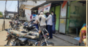
माही की गुंज, कृतलगढ़ (राज.)

एक तरफ पूरा प्रदेश कोविड-19 के चलते कई तरह की परेशानियों का सामना करने के लिए मजबूर है और सरकार के द्वारा कोरोना से बचाव के लिए गाइडलाइन जारी की गई है और कई जिलों में बंद रखा गया है मगर झाबुआ जिले के पेटलावद सहस्रील के ग्राम बनी में अवैध झोलाछाप बंगालियों पर कोरोना जैसी महामारी का कोई भय नहीं है, इन अवैध झोलाछाप बंगालियों के द्वारा अपने वस्तीक पर