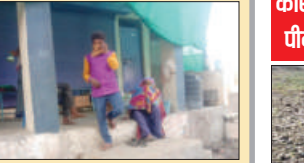
माही की गुंज, कृतलगढ़ (राज.)