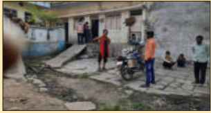
माही की गुंज, ब्रजम गुला

एक तरफ पूरा प्रदेश कोविड-19 के चलते कई तरह की परेशानियों का सामना करने के लिए मजबूर है और सरकार के द्वारा कोरोना से बचाव के लिए गाइडलाइन जारी की गई है और कई जिलों में बंद रखा गया है मगर झाबुआ जिले के पेटलावद सहस्रील के ग्राम बनी में अवैध झोलाछाप बंगालियों पर कोरोना जैसी महामारी का कोई भय नहीं है, इन अवैध झोलाछाप बंगालियों के द्वारा अपने वस्तीक पर