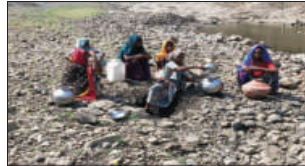
हलकवाड़ा गांव में तेलनी नदी के नुबुछे घड़े में खूब पानी भरती मिलता।

कोरोना के कहर: घाटा क्षेत्र की जनता पीने के पानी को गुड़ों में रही तलाश