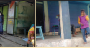
माही की गुंज, कृतलगढ़ (राज.)

मरीजों को इकट्ठा कर बिना मास्क, बिना सोशल डिस्टेंसिंग के इलाज किया जा रहा है और भोले-भाले आदिवासियों से मोटी रकम दूटी जा रही है। वही मौसम के बदलाव से आसपास के क्षेत्रों में बुखार और टाइफाइड के मरीजों की संख्या अधिक बढ़ रही है उन्ही के चलते ग्रामीण क्षेत्रों में भय का माहौल व्याप्त है की यदि हम सरकारी अस्पताल में इलाज करवाने जाते हैं तो हमें कोरोना पॉजिटिव समझ कर धरती किया जाएगा और हमें कुछ दिनों बाद जबरदस्ती मार दिया जाएगा और हमारे शरीर में से कीमती सामान निकाल कर हमारा अंतिम संस्कार कर दिया जाएगा। इस भय के कारण ग्रामीण क्षेत्र के लोग सरकारी अस्पताल में इलाज करवाने के बजाय अवैध झोलाछाप बंगालियों से इलाज करवा रहे हैं, मगर इन बंगालियों के द्वारा कोविड-19 की गाइडलाइन का पालन नहीं किया जा रहा है और बिना किसी डर के भोले-भाले आदिवासियों को इकट्ठा कर उनका इलाज किया जा रहा है। गांव में वरों से जने बंगालियों द्वारा